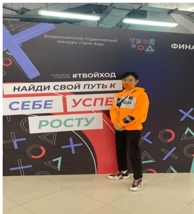
фото: предоставлено героем публикации автор: Гуляева Дария

- Терпению, умение работать в команде, учиться на ошибках, работать на дедлайнах. Этот конкурс помог мне стать более открытым, научил выражать свои мысли и идеи, не бояться чужого мнения или оценки. Желаю всем стремиться к своим целям и мечтам, потому что только так вы сможете показать себя с лучшей стороны, сказать миру что вы есть!